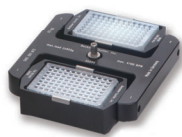
スウィングロータ S6096

最高回転数：18,000 rpm 最大遠心力：29,756 xg 容量：24本×2.0 mL